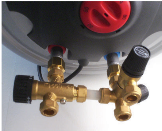
LK Armatur varolaiteryhmä termostaattisella sekoitusventtiilillä