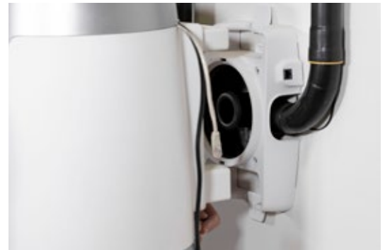
Uusiksi ajateltu seinätelineen kiinnitys

Keskuspölynimurit kiinnitetään vaivattomasti seinään seinätelineen avulla. Tulo- ja poistoilma voidaan tuoda seinätelineelle kummasta suunnasta tahansa. Keskusyksikkö kiinnitetään tukevasti telineeseen uuden click-kiinnityksen avulla ja asennetaan tulo- ja poistoilmaputket paikoilleen.