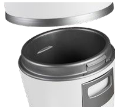
Suuri ja tilava roskasäiliö pikakiinnityksellä

Pölypussin käyttö roskasäiliössä tekee roskien tyhjentämisestä entistä hygieenisempää ja siistimpää. Pölypussi on saatavana lisävarusteena kaikkiin malleihin.