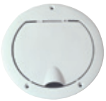
80792 Ulospuhallusventtiili Siisti poistoputken venttiili ulkoseinään.