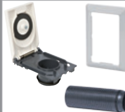
Vanhojen rasioiden päivitykseen: 80175 Classic-kansiasennelma 80195 Uppoasennuskehys tai 80205 Kohoasennuskehys 80214 Jatke+tiiviste. Jatketta käytetään, kun kansiasennelma holkki ei ylety kulmayhteeseen.

Lisätarvikkeet saat hyvinvarustetuilta jälleenmyyjiltämme.