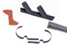
81055 Letkuteline 81053 Suulakepidike 81054 Letkun sivupidikkeet 80917 Suulakeadapteri