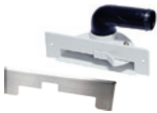
81009 Rikkaluukku, valkoinen 81034 Rikkaluukku, musta 80289 Rikkaluukun RST-etulevy Lakaise keittiön, eteisen tai tuulikaapin roskat suoraan luukusta keskusyksikön uumeiniin. Käynnistyy luukun avauksella.