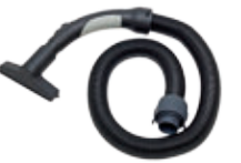
81010 Rikkaimuri Rikkaimurin letku venyy ja palautuu metristä neljään metriin. Kätevä keittiön, eteisen tai autotallin pikasiivouksiin.