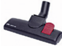
80877 Lattia/mattosuulake Lattia/mattosuulake 270, pyörällä.