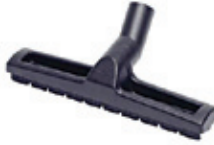
80991 Parkettisuulake 300 81263 Parkettisuulake 370 Kevyt ja tehokas suulake parketti-, laminaatti- ja laattapinnoille.