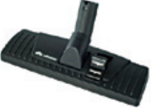
80867 Lattia/mattosuulake Lattia/mattosuulake 300 ilman pyöriä.