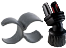
80870 Huonekalukaksoissuulake Kaksoisuulakkeella eri muodot ja pinnat siistiyvät katevästi. Kätevän pidikkeen ansiosta suulake kulkee imuroitaessa mukana.