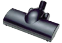
80717 Mattotamppari Imuilmalla toimiva mattotamppari suurten tekstiilipintojen kuten mattojen ja kokolattiamattojen tamppaukseen.