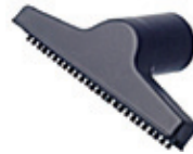
80981 Tekstiilisuulake Pieni, kätevä lisävaruste tekstiilien puhdistukseen.