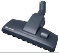
80876 Lattia/mattosuulake Lattia/mattosuulake 300, pyörällä.