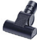
80712 Huonekalutamppari Imuilmalla toimiva huonekalutamppari sohvien, nojatuolien, patjojen ja auton istuimien puhdistamiseen.