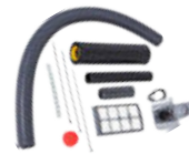
81116 Asennussarja Aparto Kit Duo-keskuspölynimurin asennussarja. Sisältää myös hepa-suodattimen, jos asunnosta ei voida johtaa poistoilmaa ulos.