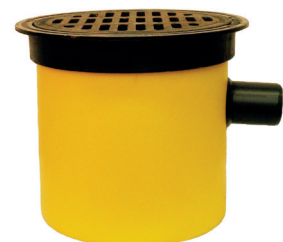
HERO 40 LK